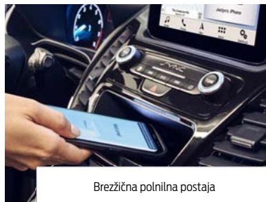
Brezžična polnilna postaja