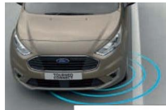
Pomoč pri vzdrževanju smeri (LKA)