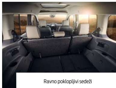
Ravno poklopljivi sedeži