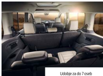
Udobje za do 7 oseb