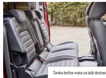
Široka bočna vrata za lažji dostop