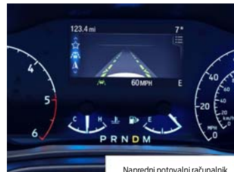
Napredni potovalni računalnik