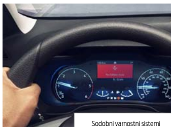
Sodobni varnostni sistemi