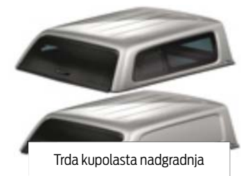
Trda kupolasta nadgradnja