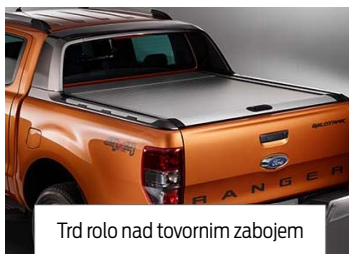
Trd rolo nad tovornim zabojem