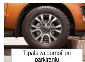
Tipala za pomoč pri parkiranju