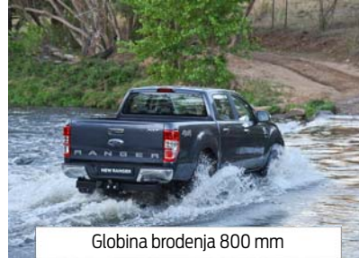
Globina brodenja 800 mm