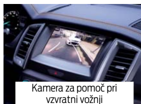
Kamera za pomoč pri vzratni vožnji