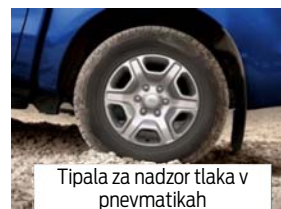
Tipala za nadzor tlaka v pnevmatikah