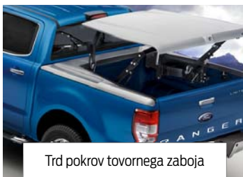
Trd pokrov tovornega zaboja