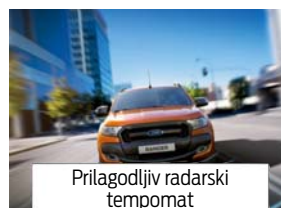
Prilagodljiv radarski tempomat