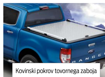
Kovinski pokrov tovornega zaboja