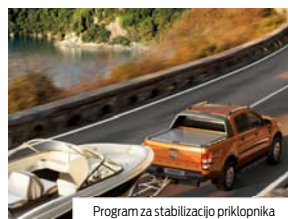
Program za stabilizacijo priklopnika