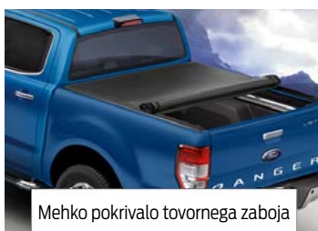
Mehko pokrivalo tovornega zaboja