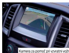
Kamera za pomoč pri vzvratni vožnji

Sistem za opozarjanje voznika nenehno spremlja vašo vožnjo in je zasnovan za to, da zazna vsakršne spremembe, ki jih povzročijo utrujenost. Če sistem zazna, da postajate manj pozorni, se bo na zaslonu prikazala opozorilna ikona, ki vam bo svetovala, da si privoščite počitek.