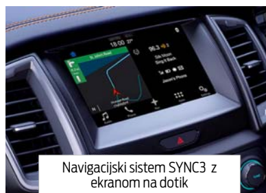
Navigacijski sistem SYNC3 z ekranom na dotik