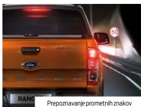
Prepoznavanje prometnih znakov

Zazna vse prometne znake, ki bi jih lahko spregledali. Naj so znaki ob cesti ali nad njo, trajni ali začasni, jih sistem za prepoznavanje prometnih znakov lahko prepozna. Na plošči z merilniki se pojavi ikona za znak za omejitev hitrosti ali prepovedano prehitevanje in se spremeni vsakič, ko vstopite v območje z novo omejitvijo. Sistem za samodejno prilagajanje hitrosti je zasnovan zato, da zmanjša možnost prekoračitve hitrosti in poveča vašo osredotočenost na cesto. Kamera za prepoznavanje prometnih znakov najprej samodejno zazna trenutno omejitev hitrosti (ko je aktivirana), sistem pa vašo najvišjo nastavitvev hitrosti nato prilagodi tej omejitvi.